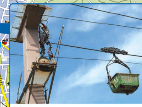
14 Materialseilbahn Heidelberg-Cement