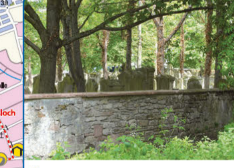
9 Alter Jüdischer Friedhof