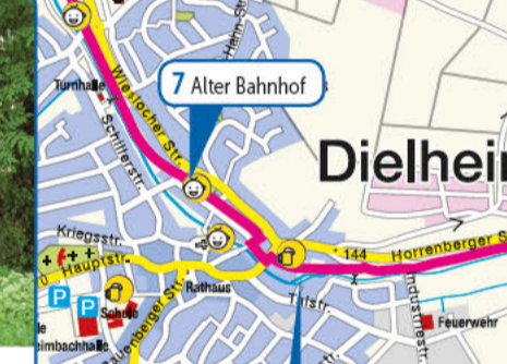
7 Alter Bahnhof