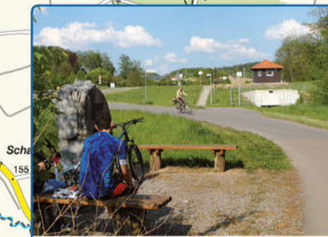
5 Hochwasserschutzanlage Unterhof