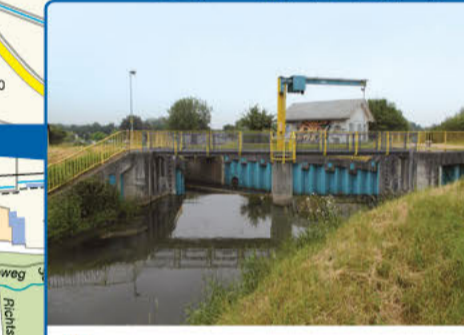
12 Verteilerwehr Hardtbach/Leimbach