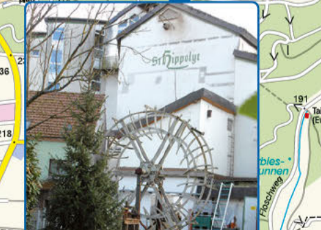
6 Mühle Ebert