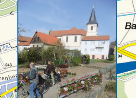
4 Dielheim, Ortsteil Balzfeld