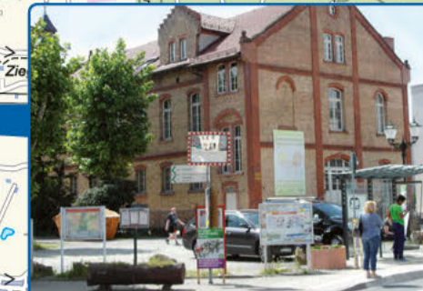
15 Alte Zigarrenfabrik